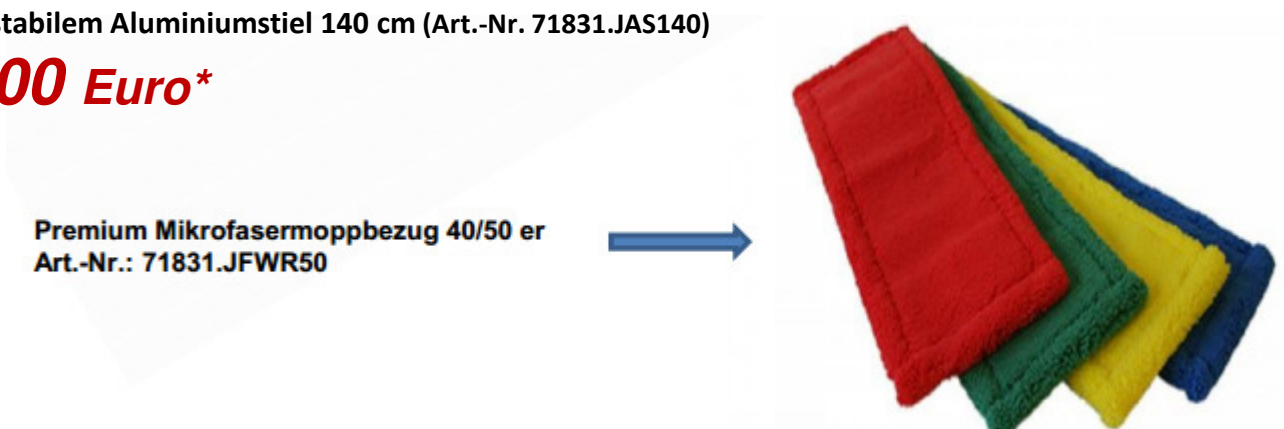
Premium Mikrofaser-moppbezug 40/50 er Art.-Nr.: 71831.JFWR50