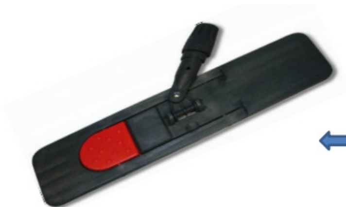
Profi Magnet-Mopphalter 40/50 er Art.-Nr.: 71831.JWSK50

DAS ANGEBOT DIESER SEITE GILT SOLANGE VORRAT REICHT – ZWISCHENVERKAUF VORBEHALTEN!